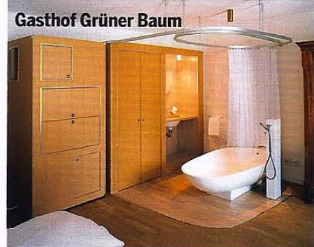
Gasthof Grüner Baum

Hotel Pragser Wildsee , Prags. Liegt an einem schönen See in den Dolomiten; ab 42 Euro p. P. inkl. HP, Tel.: 0039/0474/74 86 02, www.lagodibraies.com