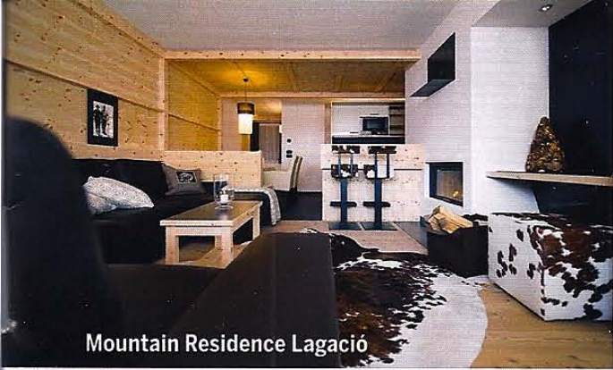
Mountain Residence Lagació