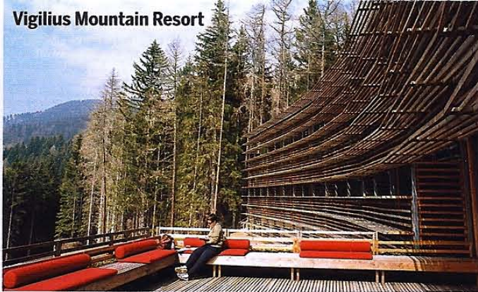
Vigilius Mountain Resort